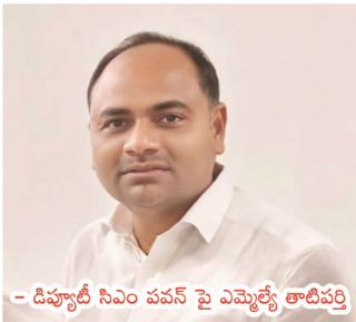
- డిప్యూటీ సీఎం పవన్ పై ఎమ్మెల్యే తాటిపర్తి

అగ్ని న్యూస్, యర్రగోండపాలెం (ఏప్రిల్ 01) : మీరు మాట్లాడుతున్న మాటలకు చేస్తున్న చేష్టలకు పొంతన లేకుండా పోతుందని ఇటువంటి రాజకీయం రాష్ట్రంలో ఏనాడు ఏ ఒక్క రాజకీయ నాయకుడు చేయలేదని ఇటువంటి రాజకీయాలు దయ చేసి చేయవద్దంటూ ఎర్రగోండపాలెం శాసనసభ్యులు తాటిపర్తి చంద్రశేఖర్ అన్నారు. ట్వెంటీ వేదికగా ఆయన మాట్లాడుతూ రాష్ట్ర రాజకీయ చరిత్రలో దేశ రాజకీయ చరిత్రలో ఇలా మాట మార్చిన రాజకీయ నాయకుడిని ఏనాడు రాష్ట్ర ప్రజలు చూడలే దన్నారు. నాడు తన తల్లిదండ్రులను తిట్టారంటూ తెలుగుదేశం పార్టీపై కారాలు మిరియాల నూరారని తదనంతరం తెలుగుదేశం పార్టీని నమ్మవద్దు కాపులకు ఆదేశాలు జారీ చేసిన విషయం ఏ ఒక్కరు మరువరన్నారు. అలాగే తాను చేగువేరా శివ్యుడు అంటూ మరో మరు నటన చూపారని ఆయన విమర్శించారు. రాజకీయం నటనవేరు కానీ రాజకీయాన్ని సైతం నటనకు పాటుపడుతున్న ఘనత ఆయనకు మాత్రమే దక్కిందన్నారు. వారు చేసిన తప్పిదాలను తాము ప్రజలకు తెలియజేస్తుంటే తమపైనే అబాందాలు వేయడం పచ్చ మీడియాలో తాను కూడా ఒక పాపుగా మారడం నిజంగా దురదృష్టకరమన్నారు. రాష్ట్ర ప్రజల కోసమే తాను పనిచేస్తానని తప్పులు ఎక్కడ జరిగిన తాను ప్రశ్నిస్తానని బరిలో నిలిచి గెలిచిన అభ్యర్థి ప్రస్తుతం జరుగుతున్న జరిగిన తప్పిదాలను ఎందుకు ప్రశ్నించడం లేదంటూ ఆయన ప్రశ్నించారు.