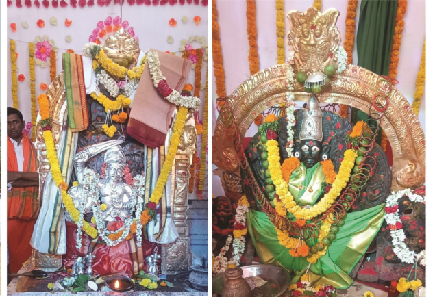
(అగ్ని ప్రతినిధి, మార్కాపురం)

పశువుల సంరక్షణకు యుద్ధం చేసిన ధీశాలి కాటమరాజు. పూర్వం పశువులే సంపద. పాడి పరిశ్రమ అందరికీ కూడు పెట్టింది. పశువుల సంరక్షణకు అలనాటి రాజులు ప్రత్యేక సైన్యాన్ని ఏర్పాటు చేసేవారని పురాణాలు, ఇతిహాసాలు చెబు తున్నాయి. మహాభారతం లో దక్షిణ గోద్రామ యాత్ర పేరుతో పశు సంపద కాపాడేందుకు సాక్షాత్తు దేవతలే ఆయుధాలు చేపట్టారు. ఇక నేటి యుగంలో గో సంతతిని వృద్ధి చేయడం, గోవులను కాపాడడం గొళ్ళల ప్రధాన వృత్తి గా ఉం డేది. యాదవ సంతతికి చెందిన కాటమరాజు గోవులను కాపాడడం కోసం యుద్ధం చేసిన వైనం తెలిసిందే. ఆ కాటవ రాజు, ప్రస్తుతం పెద్దారవీడు మండలం గుండంచర్ల వద్ద కొలువై ఉండి పశు సంపద కాపాడారు. అప్పటి నుంచి యా దవులు కాటమరాజు ను తమ ఇలవేల్పు గా భావిస్తూ ఉగాది ముందురోజు ఉత్సవాలు చేస్తారు. కాటమరాజు స్వామికి ప్రతి ఏడాది ఉగాది పర్వదినం ముందు రోజున తిరునాళ్ళ అత్యంత వైభవంగా నిర్వహించడం, భక్తు సంఖ్యలో వచ్చి ప్రత్యేక పూజలు నిర్వహించడం ఆనవాయితీగా మారింది. పెద్దారవీడు మండలం గుండంచర్ల గ్రా మ శివారులో ఉన్న కాటమరాజు దేవస్థానానికి భక్తులు భారీగా తరలివచ్చి మొక్కులు తీర్చుకోవడం ఆయన పట్ల వారి కున్న విశ్వాసానికి నిదర్శనం. ఉత్సవాలలో భాగంగా స్వామి వారికి అభిషేకాలు, ప్రత్యేక పూజలు, బొల్లావుల ఊరేగిం పులు ఉంటాయి. భక్తులను అలరించి, ఆకర్షించేందుకు అన్నీ పార్టీల నాయకులు విద్యుత ప్రభలు ఏర్పాటు చేసి సాంస్కృతిక కార్యక్రమాలను ఏర్పాటు చేశారు.