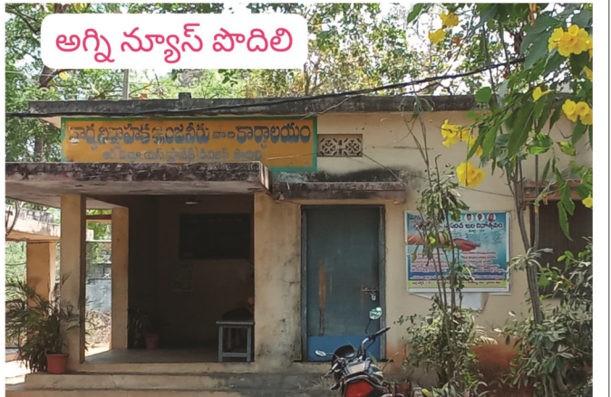
- లంచాలకు కేరాఫ్ గా డివిజన్ కార్యాలయం

అగ్ని న్యూస్, పొదిలి (మార్చి 25) : గ్రామీణ నీటి పారుదల శాఖ డివిజన్ కార్యాలయం కు అవినీతి చీద అంటుకుంది. ట్యాంకర్ల నీటి బిల్లులు వస్తే.. ఆర్డర్లు అధికారులకు కాసుల పంట గా మారుతోంది. ఇటీవల కాలంలో సుమారు 13 కోట్ల రూపాయల మేర నీటి బిల్లులు విడుదల చేశారు. చేయి తడిపి తేనే.. బిల్లు చేస్తున్న ఆర్ డబ్ల్యుఎస్ అధికారులు అంటూ కాంట్రాక్టర్ల ఆవేదన వ్యక్తం చేస్తున్నారు. కాంట్రాక్టర్ల నుండి మూడు నుండి ఐదు శాతం కమిషన్ తీసుకుంటున్నట్లు సమాచారం. మామూళ్ల మత్తులో ఆర్ డబ్ల్యుఎస్ డివిజన్ అధికారులు తూగుతున్నారని విమర్శలు వినిపిస్తున్నాయి. ఆర్ డబ్ల్యుఎస్ ఉన్నతాధికారులు నెల మాముళ్లు తీసుకుని, డివిజన్ కార్యాలయంలో జరుగుతున్న అవినీతి అరాచకాన్ని పట్టించుకోవడం లేదు అనే విమర్శలు వినిపిస్తున్నాయి. ఇప్పటికైనా జిల్లా ఉన్నతాధికారులు దృష్టి సారించి మామూళ్ల మత్తులో మునిగిపోయిన అధికారులు, బిల్లులు చేసే సిబ్బందిపై కఠిన చర్యలు తీసుకోవాలని మండల ప్రజలు కోరుతున్నారు.