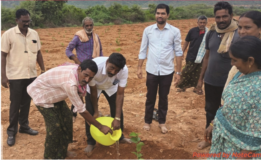
Powered by NoteCam