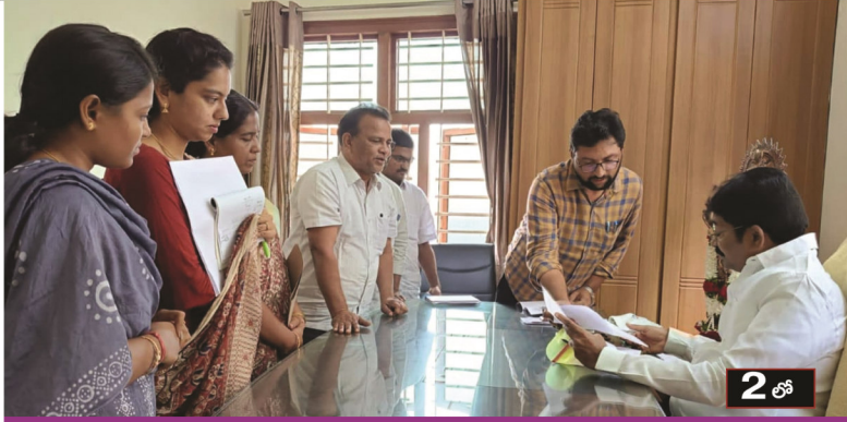
అధికారులతో సమావేశమైన ఎమ్మెల్యే ముత్తుముల